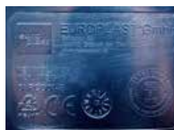
Relief printing Тиснение

Foot entry for easy tipping Отверстие для ступни для удобства открытия