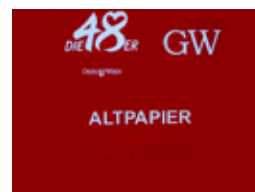
Hot printing Горячее тиснение