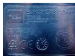
Relief printing Тиснение

Foot entry for easy tipping Отверстие для ступни для удобства открытия