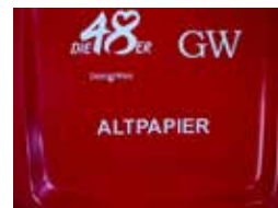
Hot printing Горячее тиснение