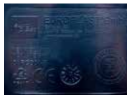
Relief printing Тиснение

Подходит для всех погрузочных механизмов DIN