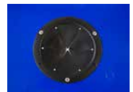
Sistem de deschidere pentru introducerea sticlei (standard Ø 160 mm, dimensiuni specială Ø 190 mm)