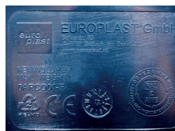
Reliefprägung Relief stamping

Für Einmann-Aufnahme For one-man lifting system