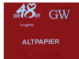
Heißprägung Hot stamping