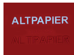
Heißprägung Hot stamping