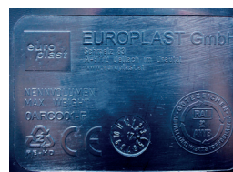
Reliefprägung Relief stamping

Für Zapfenschüttung oder mit Metallaufnahmetasche für DIN- und Sondergabelmaße For pin lifting system or with metal lifting pocket for DIN and special fork sizes