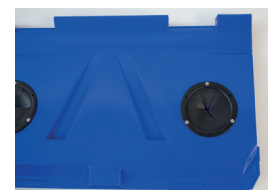
Glaseinwurföffnung (Standard Ø 160 mm, Sondermaß Ø 190 mm) Glass opening (standard Ø 160 mm, special size Ø 190 mm)