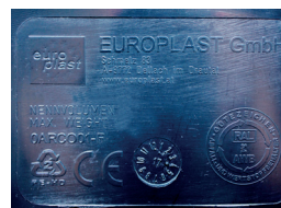
Reliefprägung Relief stamping

Für Einmann-Aufnahme For one-man lifting system