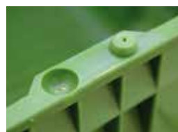
Противоскользящий захват Anti-slip catch

Reach-konform, предназначенный для хранения продуктов REACH-compliant, made for food storage