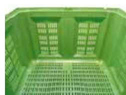
Внутренний вид Inner view