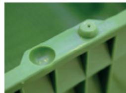
Rutschsicherung Antislip protection