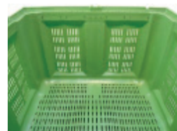
Innenansicht Inner view