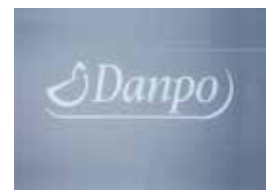
Heißprägung und Nummerierung Hot printing and numbering