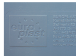
Reliefprägung Relief stamping