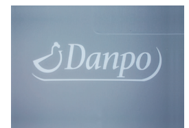
Heißprägung und Nummerierung Hot stamping and numbering