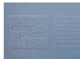
Reliefprägung Relief printing