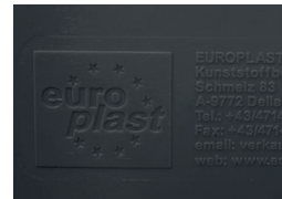
Reliefprägung Relief stamping