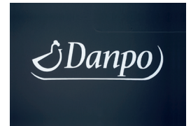
Heißprägung und Nummerierung Hot stamping and numbering

+ EINSATZ VON ÖKOSTROM USE OF GREEN ELECTRICITY