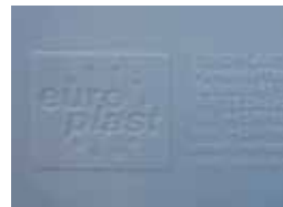
Reliefprägung Relief printing