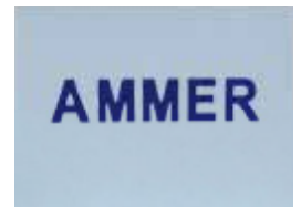
Heißprägung Hot printing