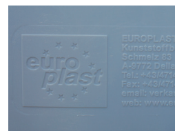
Reliefprägung Relief stamping