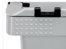
Noppenfeld Nubbed area