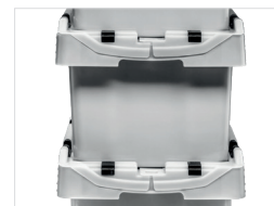
Komfortable Stapelung Convenient stacking