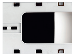
Batterieeinwurf Battery intersection