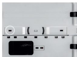
Verplombung Lead sealing