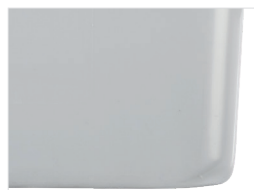
Mit seitlichen Sicken With lateral corrugations